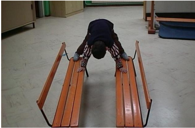
Déplacement en quadrupédie.

Une séance dure en moyenne 40 mn en comprenant un petit retour au calme à la fin ! Soit en écoutant de la musique douce soit en écoutant un conte que lit maman ou papa.